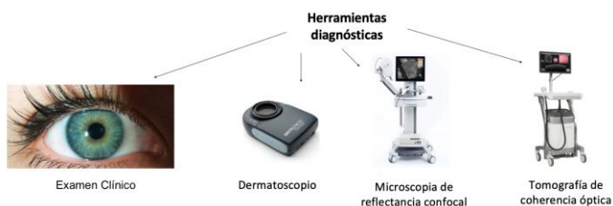
Figura 1. Herramientas para el diagnóstico de la queratosis actínica

Fuente: Actinic Keratosis and Non-Invasive Diagnostic Techniques: An Update. Biomedicine. 2018 10