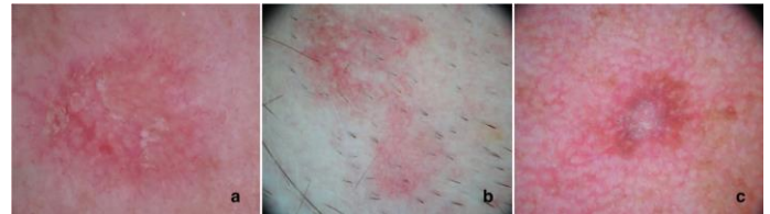
Figura 2. Dermatoscopia de queratosis actínicas

En la figura 2.a se observa el patrón de fresa con escamas; 2.b se observa un patrón de fresa sin escamas; 2.c se observa una lesión levemente pigmentada asociada a una pseudored eritematosa con escamas.