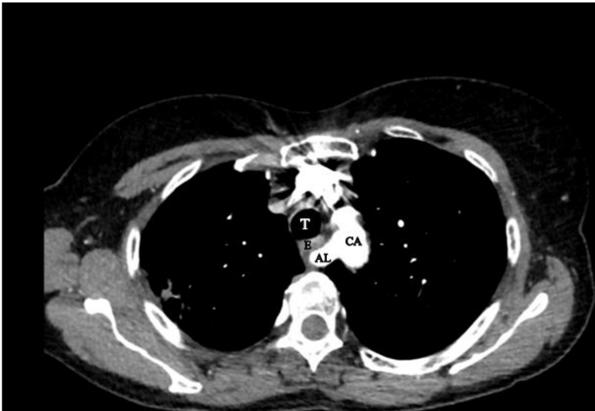
Figura 2. Tomografía computada de tórax con contraste en vista transversal. Se aprecia origen de arteria lusoria (AL) en el cayado aórtico (CA) cruzando por detrás de la tráquea (T) y esófago (E) hacia el miembro superior derecho.

El origen aberrante de la arteria subclavia derecha usualmente nace de un aneurisma llamado divertículo de Kommerell. 1 Dicha arteria aberrante puede crecer de gran tamaño ocasionando una compresión del esófago y produce sintomatología (disfagia lusoria). 1 Si hay compresión del nervio laríngeo recurrente se conoce como síndrome de Ortner. 2 Este fue un hallazgo incidental en la paciente, demostrando que muchas veces puede ser una variante anatómica asintomática. El diagnóstico se hizo mediante TC contrastado y el mismo tiene 100% de sensibilidad para la patología. Es importante saber que dicha patología existe ya que puede causar sintomatología. Los abordajes quirúrgicos por cualquier otra causa deben tenerla en consideración para evitar complicaciones como hemorragias mortales. 3 Como la paciente era asintomática y su dolencia principal no estaba relacionada a este hallazgo, no fue necesario la corrección de la anomalía.