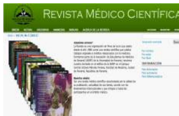
Figura 3. Formato de presentación On Line de la RMC utilizando OJS.

Con este nuevo formato (ver Figura 3), se supera la gestión editorial manual para realizar un proceso totalmente digital a través de OJS, software libre diseñado para gestionar, editar y publicar revistas; el mismo es muy utilizado en la actualidad por los principales revistas a nivel global y su objetivo es mejorar la calidad académica de la publicación de las revistas que lo utilizan, con políticas transparentes que le permiten a las revistas aspirar a la indización. 13