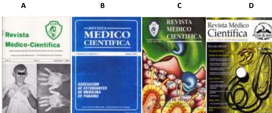
Figura 3. Galería de Portadas. A) Formato de presentación de los números de la década del 80, B) Nuevo formato en 1992, C) En 1995 se presentó nueva portada, D) A partir del año 2000 la RMC cambia a su último formato impreso.

A finales de los años 90, el internet hizo su expansión en Latinoamérica y en Panamá no fue la excepción. La Facultad de Medicina en el año 2000, bajo la administración del Dr. Enero Avilés como decano, se vio en la necesidad de la creación de un ente capaz de divulgar todas las actividades que en ella se llevaban a cabo.