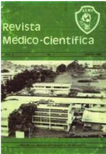
Figura 1. Portada del Volumen 1 Número 1 de la RMC, donde se muestra la Facultad de Medicina.

RMC junto al resto del comité editorial.